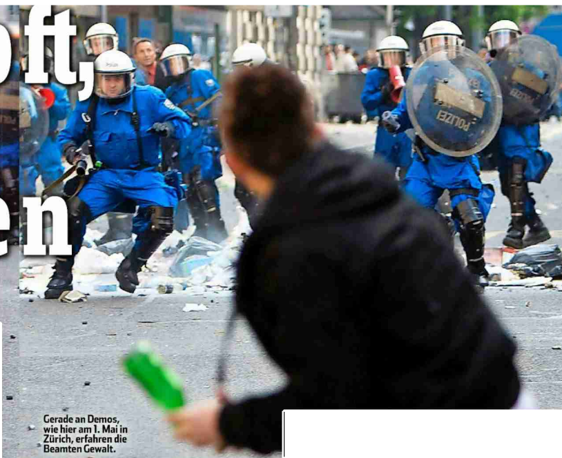
Gerade an Demos, wie hier am 1. Mai in Zürich, erfahren die Beamten Gewalt.

Der Beruf des Polizisten wird immer gefährlicher. Ein Angriff im Appenzell endete beinahe tödlich. Parlamentarier fordern für Täter höhere Strafen.